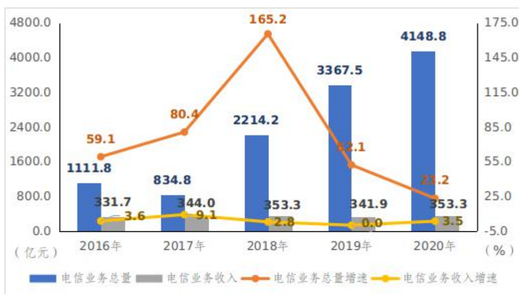
图1 “十三五”时期全省电信业务总量和收入情况

电信业务发展成效显著。截至“十三五”末，全省电信业务总量达 4148.8 亿元，约为“十二五”末的 8 倍，总体保持较快增长态势。2020 年完成电信业务收入 353.3 亿元，“十三五”期间年均增速达 3.8%，位居西部前列。“十三五”期间，我省共发增值电信业务经营许可证 556 家，持省证企业达到 884 家，较“十二五”增加 169.5%；电信增值业务收入由 31.75 亿增长到 115.79 亿元，平均年增速达到 29.5%。五年来，全省信息通信行业累计完成固定资产投资额达 469.6 亿元，为缩小城乡数字鸿沟、建设网络强省奠定坚实基础。